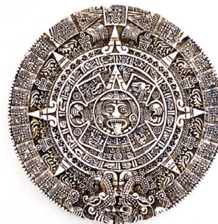
Illustration des Maya-Kalenders